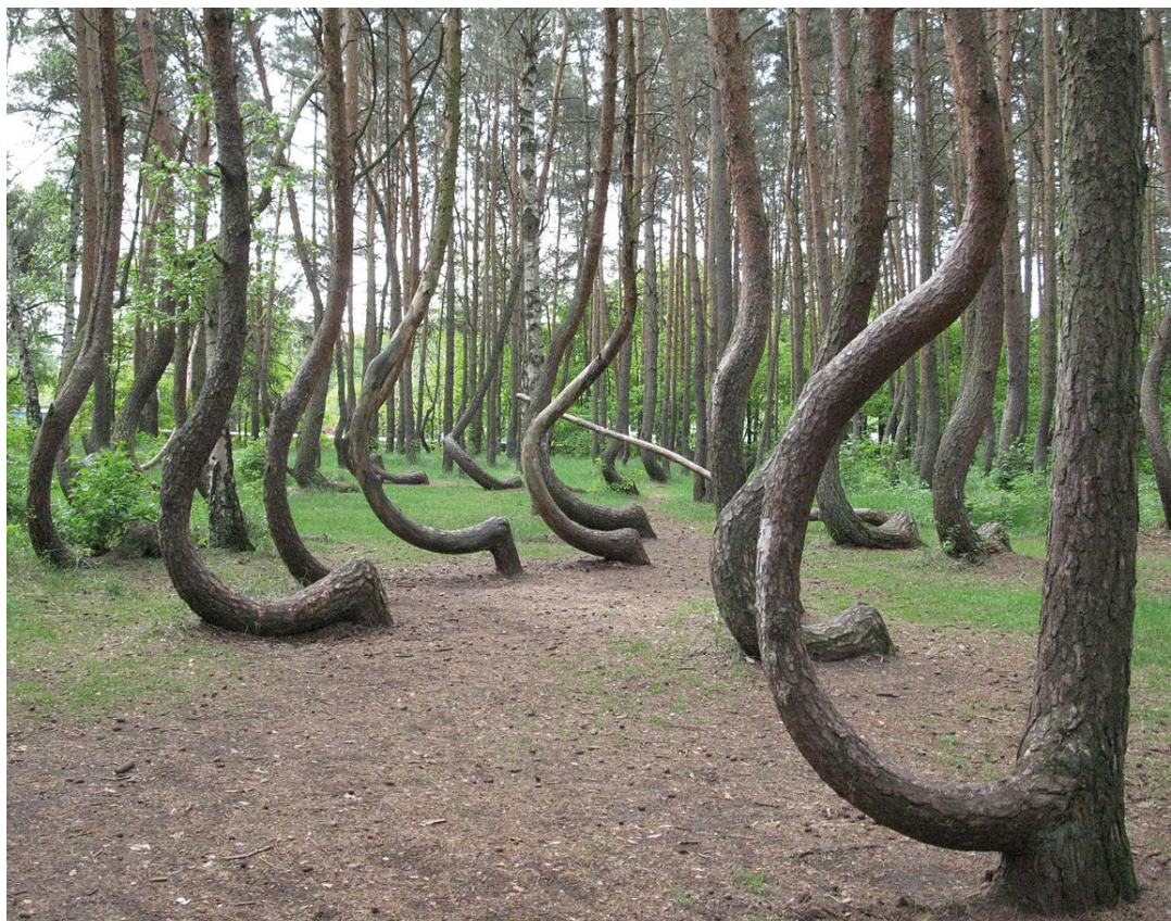
Courbures basales exceptionnelles sur pins sylvestres « torturés » pour produire des bois courbes (Gryfino, Pologne).

qui étudie les mécanismes chimiques et moléculaires et l'écologie des réponses des plantes à l'herbivorie 12 . Dans une récente conférence à Nancy le 12 avril 2018, il nous parlait de ses travaux sur la communication entre espèces et de son influence sur la composition en espèces des communautés végétales. Contrairement à ce qui semble implicite dans le conte de Peter Wohlleben où « les mères protègent leurs enfants », les signaux émis n'informent et ne protègent pas seulement les individus de la même espèce. Ces recherches à dimension écologique, dans le milieu naturel diversifié en espèces et complexe en interactions, ne font que commencer car historiquement, les études ont plutôt été conduites par des physiologistes sur quelques plantes modèles en chambre de culture.